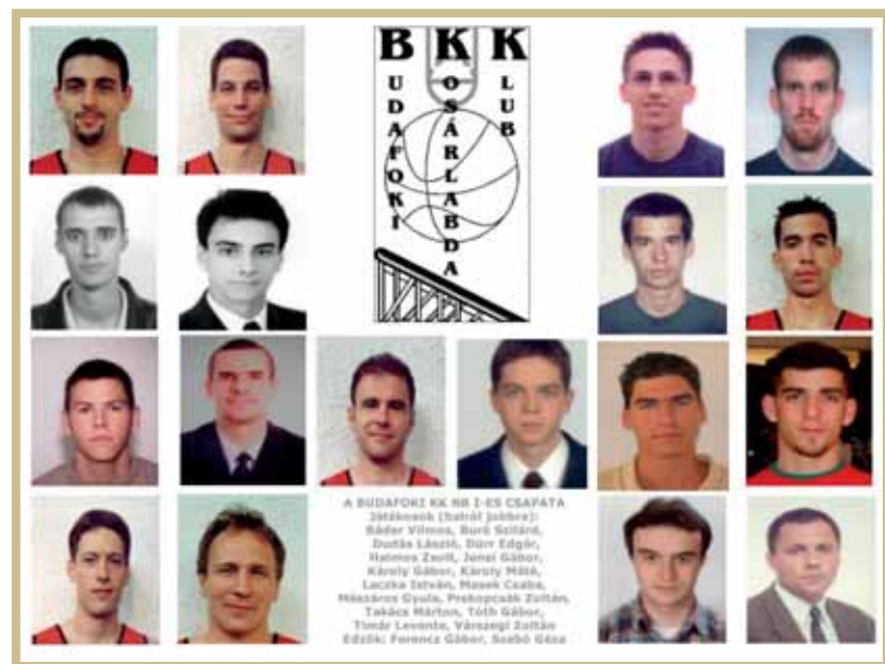
A Budafoki KK NB I-es csapata

2012 kora nyarán az „A” csapat a „Szuperkupáért” vívott küzdelem-sorozatban az Ultimate Warrior gárdájától még szoros küzdelemben kikapott, ám aztán 79-68-ra legyőzte a Kerék SC, majd 76-62-re a Student KC csapatát.