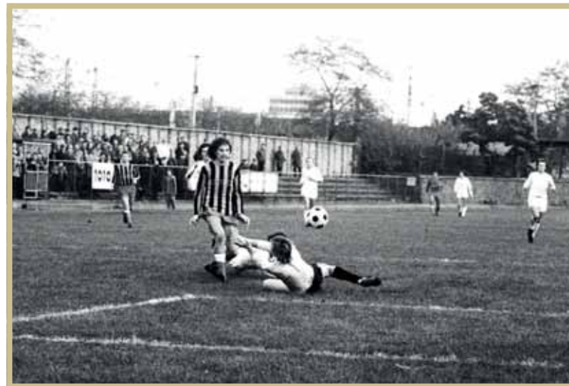
Egy tipikus Esterházy-gól a sok közül