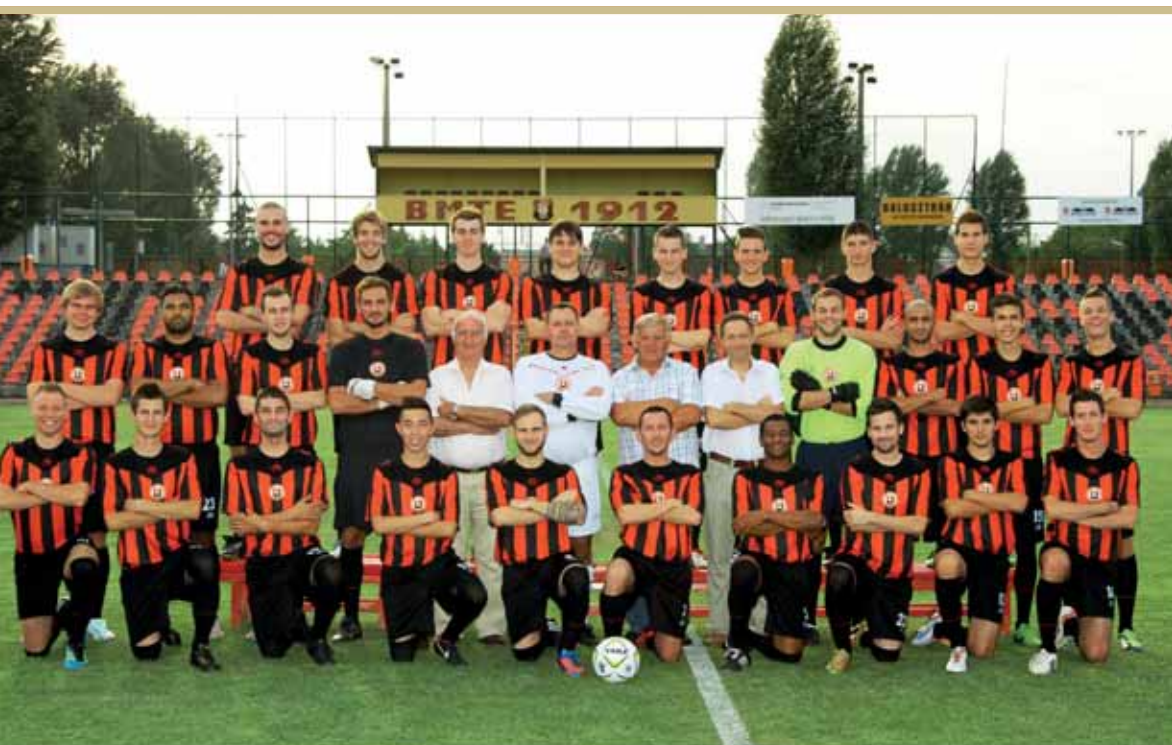
A BLC felnőttcsapata, 2012.