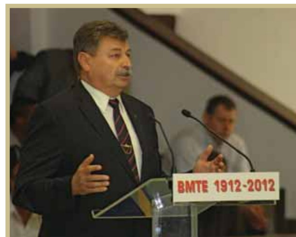
Szabolcs Attila, Budafok-Tétény polgármestere