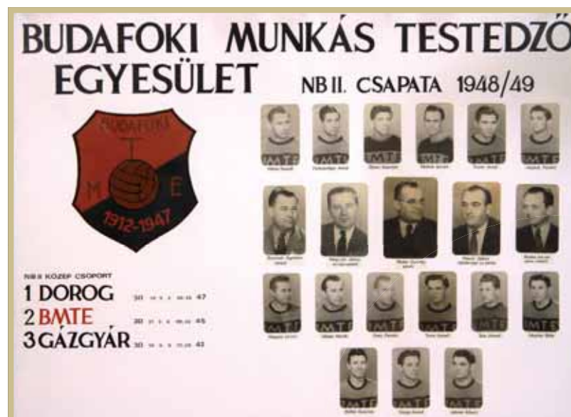
Az 1948–1949-es nagyszerű csapat