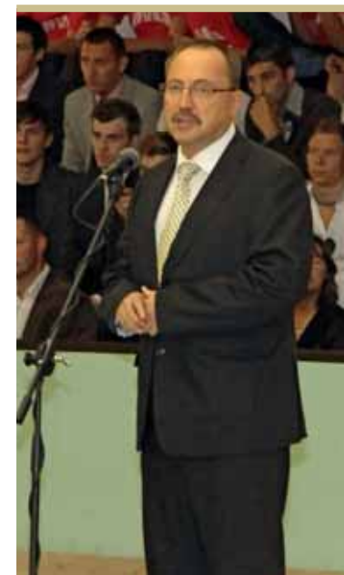
Németh Zsolt, az Országgyűlés külügyi bizottságának elnöke

„Vigyázunk a költségvetés egyensúlyára, nem zárunk be iskolát, és minden erőnkkel a kerületi sportélet támogatását tartjuk szem előtt” – emlékeztetett a kerületi vezetőség alapelveire Szabolcs Attila.