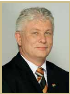
Karsai Ferenc alpolgármester