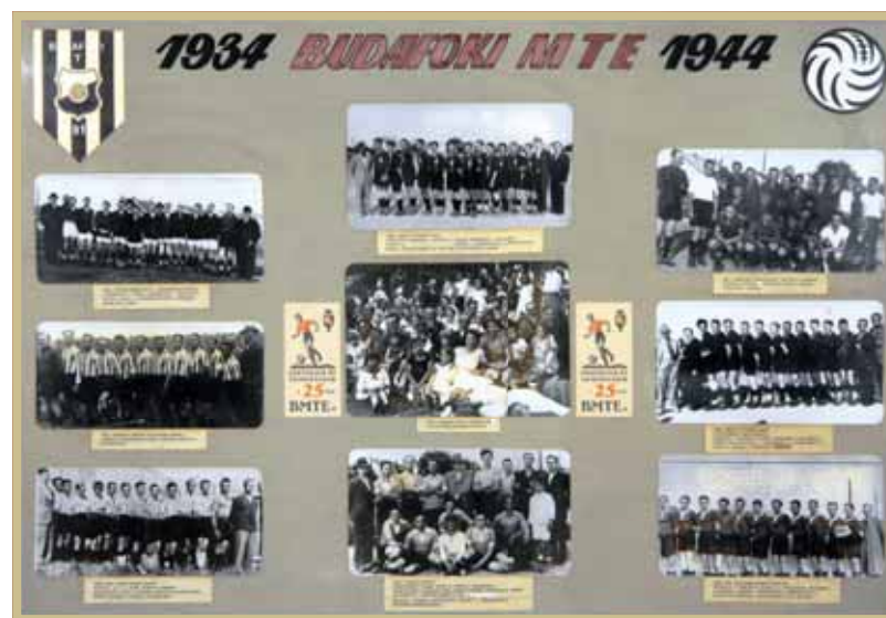
A harmincas évek közepétől a II. világháborúig

A 40-es évek elején stabil gárda alakult ki, amely – az akkor megszervezett NB III-as, azaz a Nemzeti Bajnokság tagjává akart válni. Az 1942-1943-as szezon meghozta a sikert. A BMTE 42 ponttal megnyerte a Déli csoportot, s egy osztállyal feljebb léphetett. Az ifi és a serdülőcsapat is a 4. helyen végzett, igazolván az egyre izmosodó utánpótlás erejét. A Dunántúli csoportban végül is 10. helyen végzett