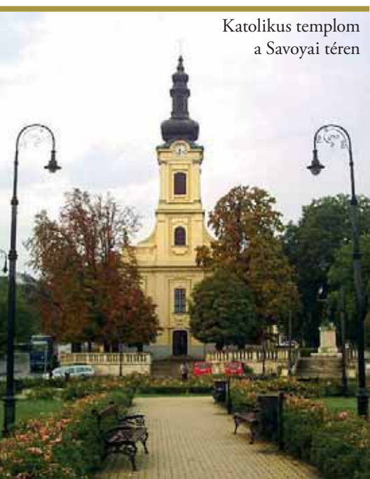
Katolikus templom a Savoyai téren

A szorgos, zárt családi életet élő német telepesek életét megpecsételte a második világháború. A jaltai és a potsdami diktátum értelmében a dunai németek többségével együtt megbélyegezték a budafoki svábokat is. A kollektív bűnösség bélyegével illették őket, és nem kerülhették el az 1945-1947 közötti kitelepítést – marhavagonokban – a kelet-németországi területekre.