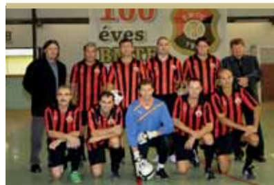
A BMTE öregfiúk csapata