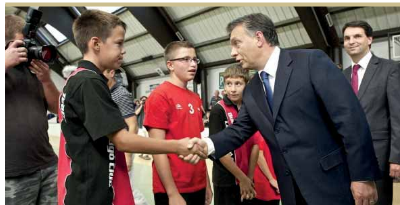
Orbán Viktor gratulál

Az ünnepi műsor az Egyesített Óvoda és a Kolonics iskola közreműködésével tartott bemutatóval folytatódott és a Parlamenti válogatott – BMTE kispályás labdarúgó mérkőzéssel zárult.