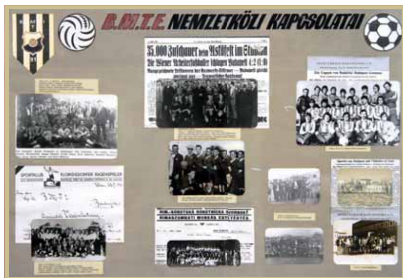
Külföldön is rettegtek és tisztelték a budafoki labdarúgókat