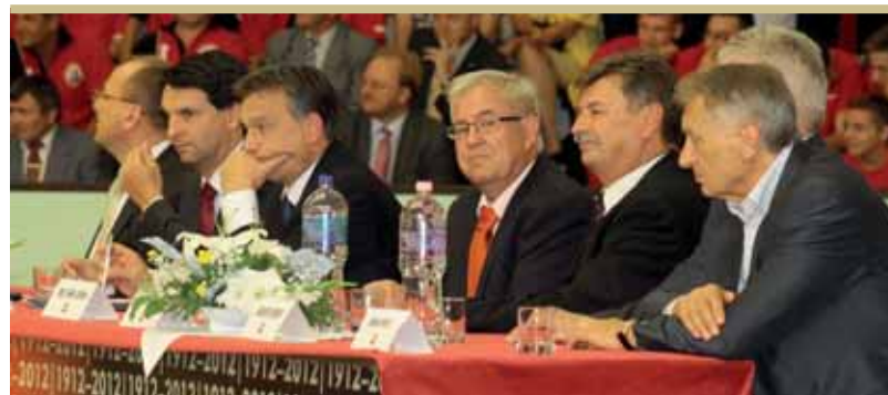
Dunai Antal olimpiai bajnok labdarúgó a kép jobb szélén

álom. Neveljünk olyan játékosokat, akik közül legalább egy felhúzhatja majd a címeres mezt a magyar válogatottban. A harmadikat a Sanyival egyetértésben mondanám a tündérnek: évtizedekig anyagi biztonságot az összes szakosztálynak.