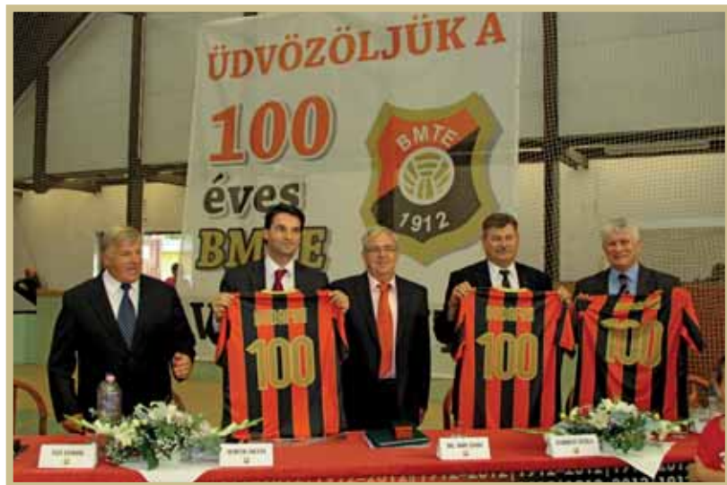
Micsoda száz év volt!