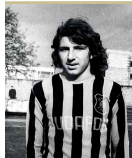
Aki később a Fradiban és a Honvédban a válogatottságig vitte, gólt rúgott a hollandoknak és a braziloknak, kint járt az 1986-os mexikói vb-n: Esterházy Márton!