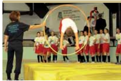
A kicsinyek vették át a terepet