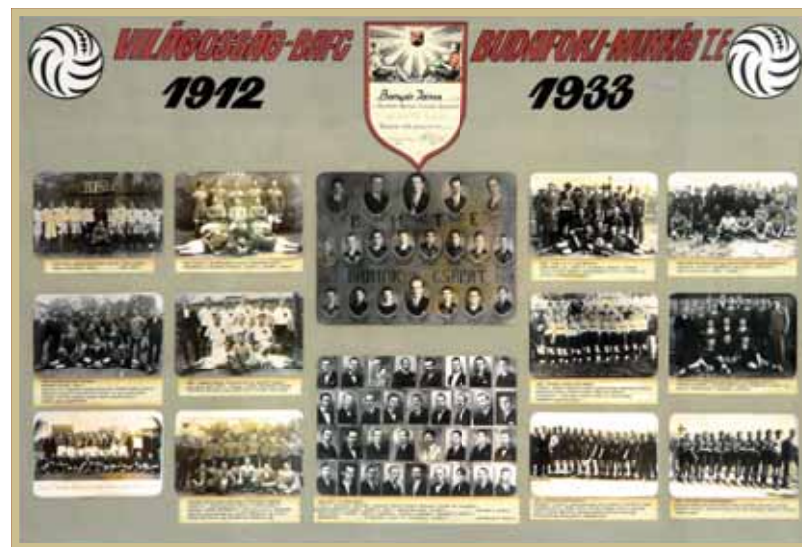
Az első két évtized

Induljunk el hát a szakosztályok történetét megismertető visszatekintésünkben!