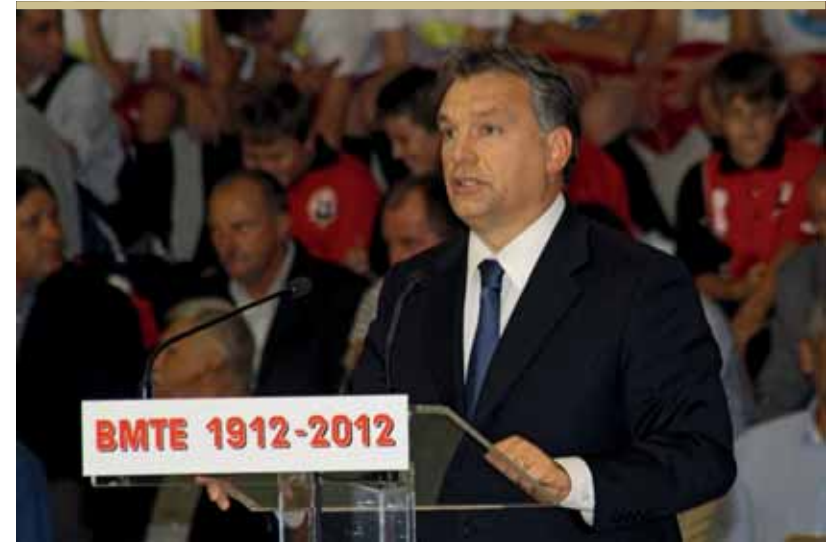
Orbán Viktor: Kis klubok nélkül nincsenek nagy klubok!

Orbán Viktor szerint a kormány célja, hogy öt éven belül a mai 9 százalékról 20 százalékra, tíz éven belül pedig 30-35 százalékra emelje az aktívan, hetente legalább kétszer fél órát sportoló magyar lakosok számát. A miniszterelnök erről a Budafoki Munkás Testező Egyesület (BMTE) megalakulásának századik évfordulója alkalmából tartott rendezvényen beszélt, hangsúlyozva, a kormány még az ősszel kidolgozza a nem látványcsapatok új támogatási rendszerét. Nos, így is történt, október végére elkészült az úgynevezett nem-látványcsapatok finanszírozási szisztémájának, a TAO-ból történő részesülés elveinek kidolgozása.