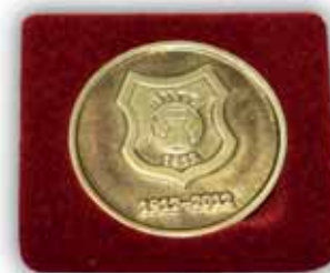
A centenáriumi emlékérem

A jubileumi közgyűlést a Csemetekert Tagóvoda apróságainak és a Kolonics György Általános Iskola diákjainak műsora színesítette. Záróeseményként a kispályás labdarúgó mérkőzésen mérte össze erejét a Parlament válogatottja a BMTE öregfiúk csapatával, mely a budafokiak győzelmével zárult.