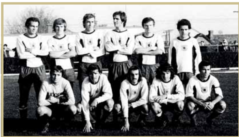
A mai ötvenesek emlékezetében élénken él e nagyszerű csapat emléke