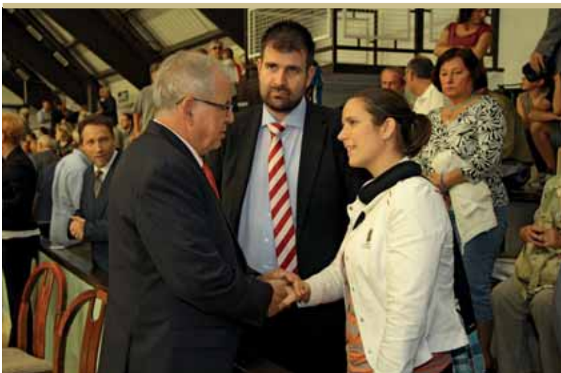
Risztov Éva úszó olimpiai bajnok is eljött az ünnepségre

– Soha nem volt kétségem, hétéves korom óta csak az olimpiai bajnoki cím lebegett a szemem előtt – nyilatkozta lapunknak Risztov Éva, a BMTE