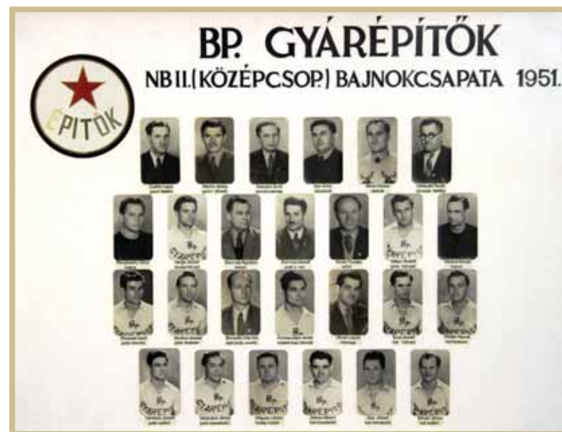
Az ötvenes években Gyárépítők néven élt tovább a BMTE

Az 50-es évek elején az egyesületek szakszervezeti, intézményi, üzemi szintű működtetése okán a BMTE Budapesti Gyárépítők néven szerepelt tovább.