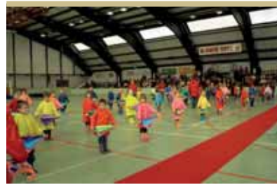
A cseméték látványos bemutatója