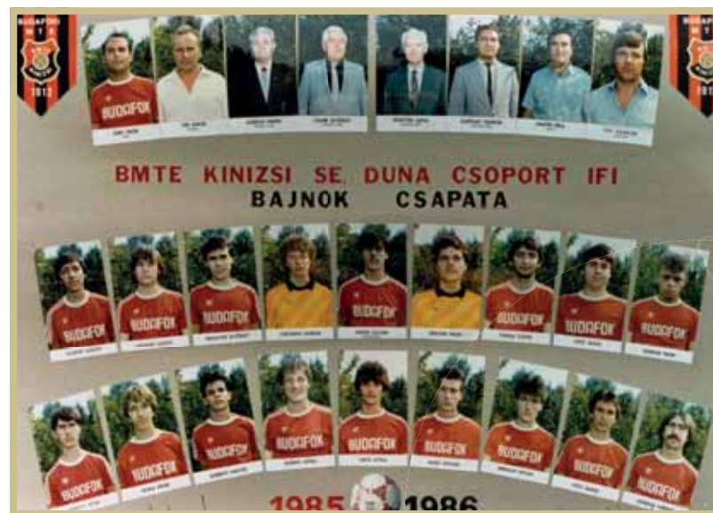
Egy kiváló ificsapat 1985-1986-ból