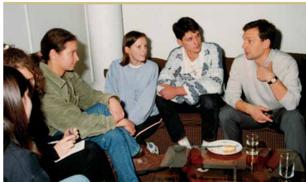
Orbán Viktor miniszterelnök első hivatali ciklusa elején, 1998-ban már ellátogatott klubunkba

Be kell látni: ez bajnokság, s ha a gyermeket bünteti a szülő, akkor ezzel a csapattal is!