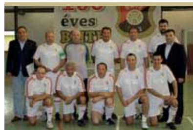
Az országgyűlés válogatottja