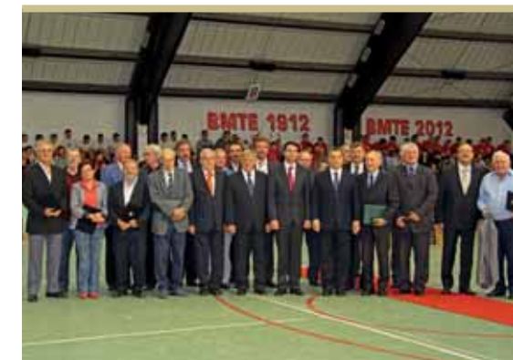
Csoportkép az ünnepelekkel