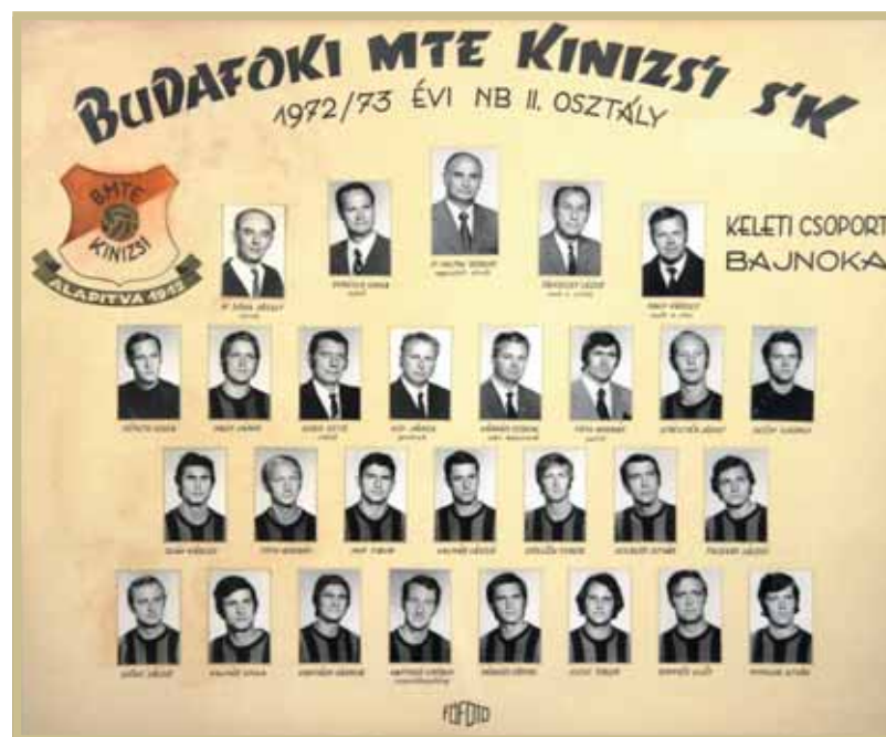
Az NB II Keleti csoportjának 1972–1973. évi bajnoka!

összetételben vívták ki e csodás diadalt!